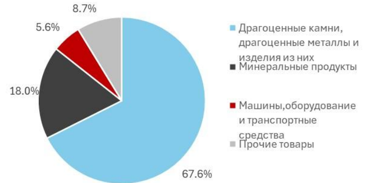
Структура импорта товаров в Россию из ОАЭ в 2023 г.